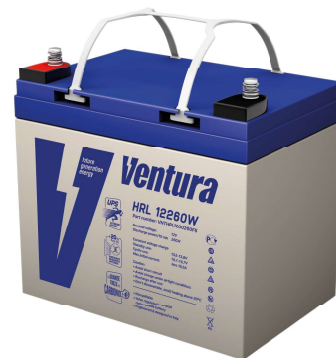
Габаритные размеры, мм

Примечание: приведены средние значения, полученные в течение трех циклов заряда/разряда Производитель оставляет за собой право вносить изменения в связи с проводящимися мероприятиями по оптимизации типов