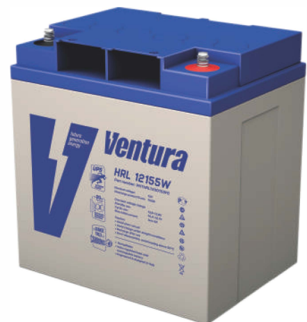
Габаритные размеры, мм