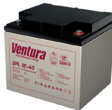
Габаритные размеры, мм

Примечание: приведены средние значения, полученные в течение трех циклов заряда/разряда Производитель оставляет за собой право вносить изменения в связи с проводящимися мероприятиями по оптимизации типов