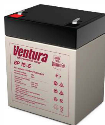
Габаритные размеры, мм