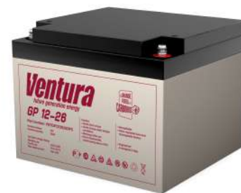
Габаритные размеры, мм