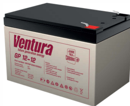
Габаритные размеры, мм